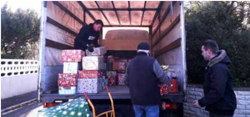
Am 14. November wurden die Geschenkpakete verladen.